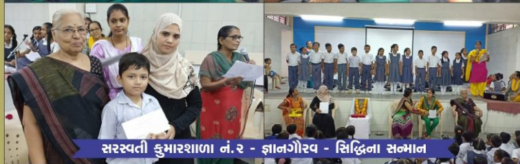
સરસ્વતી કુમારશાળા નં.૨ - જ્ઞાનગૌરવ - સિદ્ધિના સન્માન