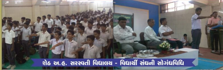
શેઠ અ.દ. સરસ્વતી વિદ્યાલય - વિદ્યાર્થી સંઘની સોગંધવિધિ