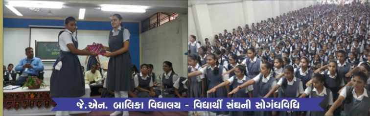
જે.એન. બાલિકા વિદ્યાલય - વિદ્યાર્થી સંઘની સોગંધવિધિ