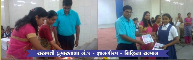
सरस्वती कुडडरशाळा नं.१ - ज्ञानगौरव - सिद्धिना संडडान