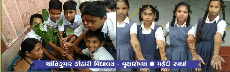
शांतिकुडडर कुडडररी विद्यालय - वृक्षारोपण • डडेंडी रूपर्धा