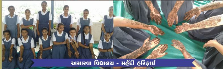
અસારવા વિદ્યાલય - મહેંદી હરિદ્ગર્થ