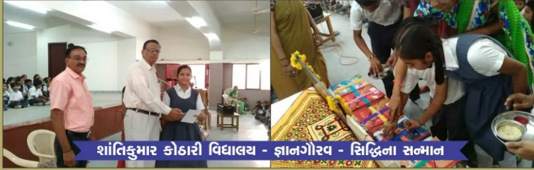
शांतिकुडडर कुडडररी विद्यालय - ज्ञानगौरव - सिद्धिना संडडान