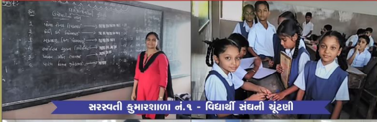
सरस्वती कुडडरशाळा नं.१ - विद्यार्थी संघनी रूँटणी