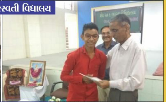
जे. सेन. जालिका विद्यालय