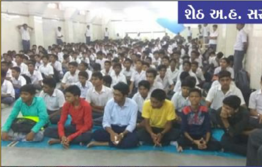
शेठ अ.ह. सरस्वती विद्यालय