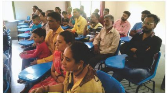
વાલી સંમેલન - સરસ્વતી બાલવિહાર