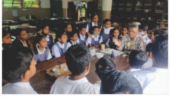
વિજ્ઞાન પ્રોજેક્ટ - સરસ્વતી કુમારશાળા નં.૧