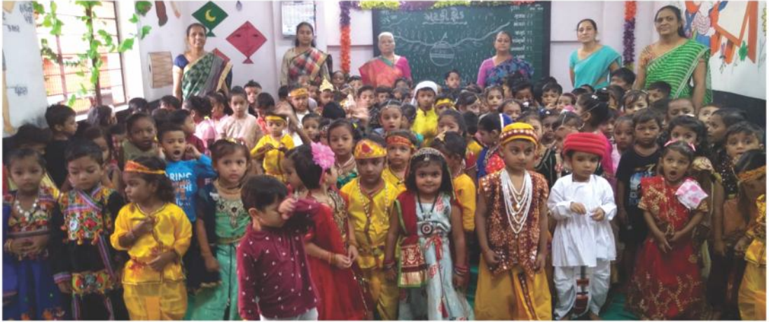
જન્માષ્ટમીની ઉજવણી - સરસ્વતી બાલવિહાર