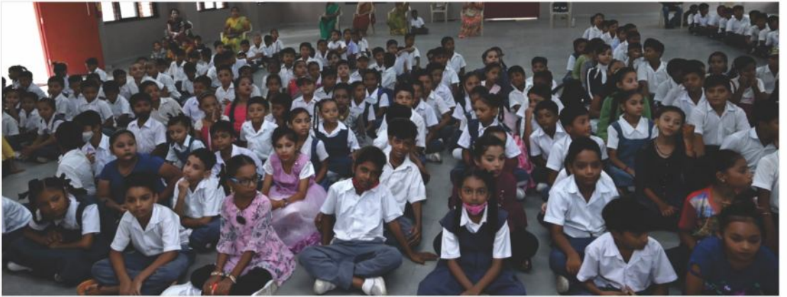
જ્ઞાન ગૌરવ કાર્યક્રમ - શાંતિકુમાર કોઠારી વિદ્યાલય