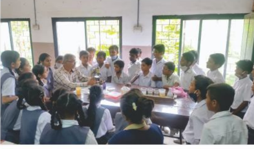
વિજ્ઞાન પ્રોજેક્ટ - અસારવા વિદ્યાલય