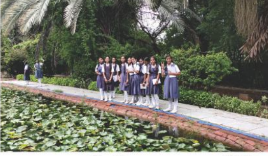
શૈક્ષણિક પ્રવાસ - માટ બોટોનિકલ ગાર્ડન - જે.એન. બાલિકા વિદ્યાલય