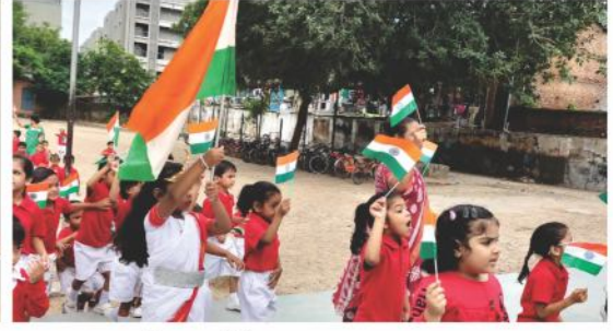
આઝાદીનો અમૃત મહોત્સવ - સરસ્વતી બાલવિહાર