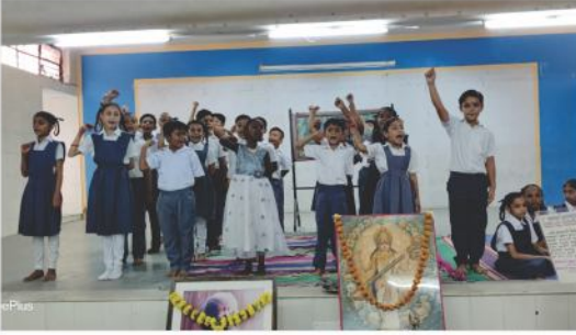
જ્ઞાન ગૌરવ કાર્યક્રમ - સરસ્વતી કુમારશાળા નં.૨