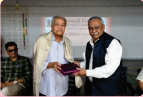
અધ્યક્ષશ્રી દ્વારા મહેમાનશ્રીનું સ્વાગત