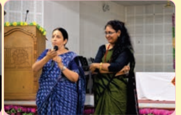
વાચિક્મ્ શ્રી નિશાબેન કાવ્યરસ દર્શન શ્રી મૂણાલબેન